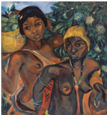
Ίωμα Στεργ (1894-1966), ΓΥΝΑΙΚΕΣ ΠΟΥ ΚΟΥΒΑΛΑΝΕ ΦΡΟΥΤΑ (1927), Λάδι σε καμβά, 885 x 800 mm